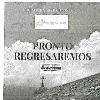
Artes de divulgación en redes sociales.